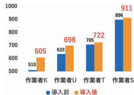
▲導入1週間時で、生産性が平均約8%アップ

また、トーカイ・メディカルリネン工場では今年8月よりピロー投入機「PFZ-2」に接続しているが、生産