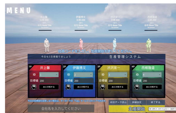
▲ゲームを始める時のような入力フォーム

作業スピードにより、はじめは歩いていた自分のキャラクターが走り出したり、レベルアップするたびにその姿も成長していく（500枚ごとにレベルアップなど、任意で設定できる）。生産数のほかにポイントもカウント。これは、経験値や投入以外の作業をする人が立つ場所等