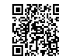
▲ REAL FOCUS

様々な産業でモチベーション向上策として注目される「ゲーミフィケーション」。作業にゲーム要素を加えることで作業意欲を高め、それがスキルアップにもつながっていく。また、現場での生産効率アップといった効果だけでなく、業務に楽しさを採り入れた職場環境は企業のイメージアップとなり、求人雇用への効果も期待できそうだ。